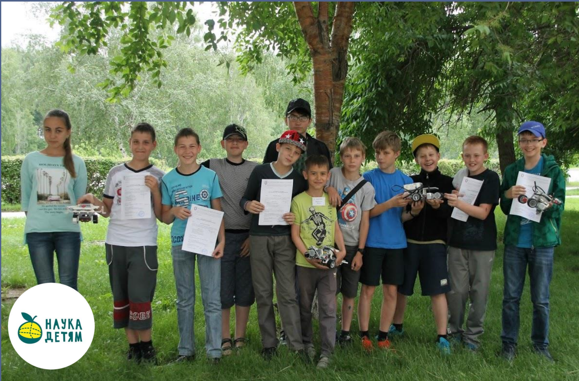
"Инженерный горизонт" в Кольцово